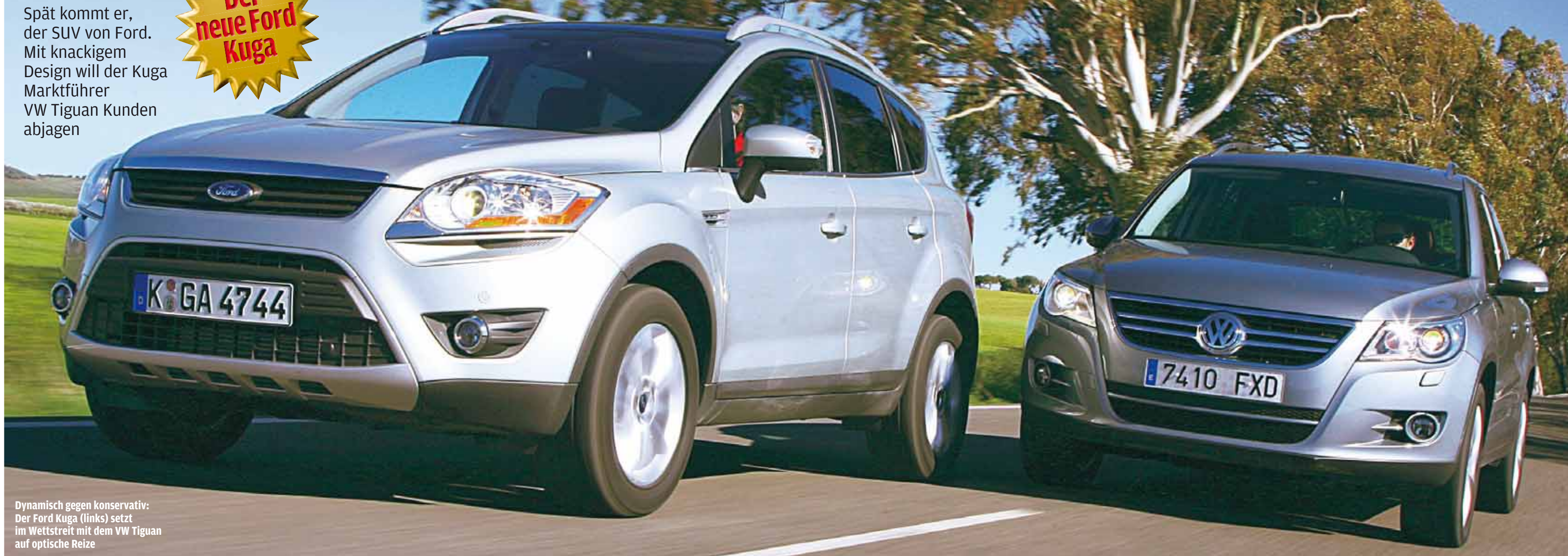
Dynamisch gegen konservativ: Der Ford Kuga (links) setzt im Wettstreit mit dem VW Tiguan auf optische Reize

Spät kommt er, der SUV von Ford. Mit knackigem Design will der Kuga Marktführer VW Tiguan Kunden abjagen