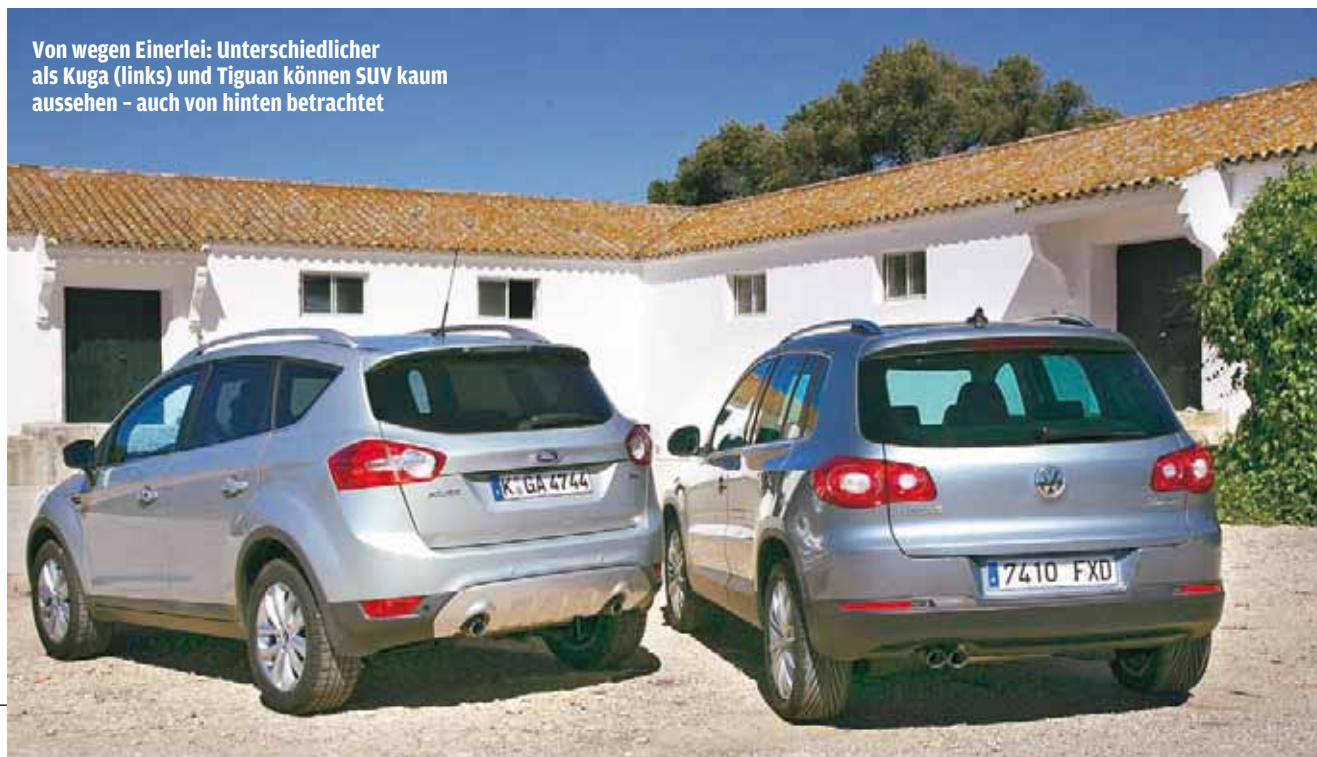
Von wegen Einerlei: Unterschiedlicher als Kuga (links) und Tiguan können SUV kaum aussehen - auch von hinten betrachtet

Praktisch: Das leicht bedienbare Rollo über dem ausreichend bemessenen Kofferraum lässt sich bei Nichtgebrauch unter dem Ladeboden verstauen. Dort finden sich zudem zahlreiche Fächer für Kleinzeug. Und das Oberteil der Heckklappe ▶