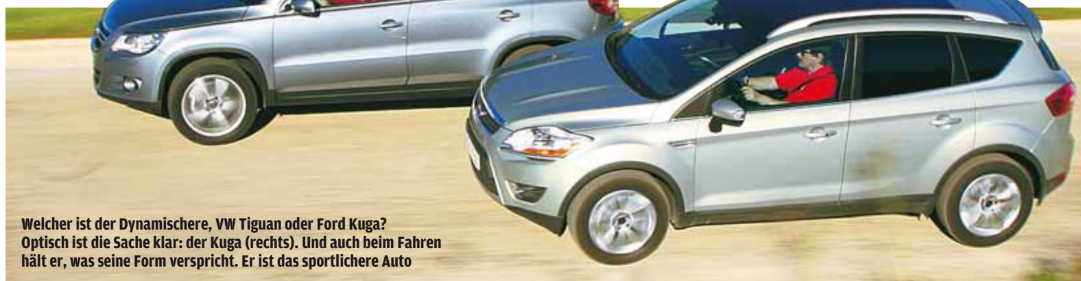
Welcher ist der Dynamischere, VW Tiguan oder Ford Kuga? Optisch ist die Sache klar: der Kuga (rechts). Und auch beim Fahren hält er, was seine Form verspricht. Er ist das sportlichere Auto

ist separat zu öffnen – geschickt fürs Einladen von Einkaufstaschen.