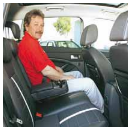
Hohe Sitzposition und ausreichend Platz im Fond, aber Sitze nicht verstellbar wie im VW