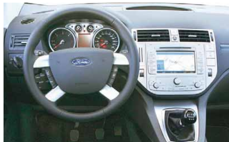
Hübsches Kuga-Cockpit, aber gekünstelte Instrumente. Das schadet der Ablesbarkeit. Touchscreen-Monitor in der Mittelkonsole wie beim Tiguan gegen Aufpreis