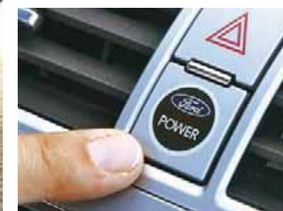
Starten per Knopfdruck, der Schlüssel kann in der Tasche bleiben