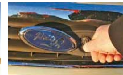
Ford-typisch: externes Schloss für die Motorhaube unter der Ford-Pflaume