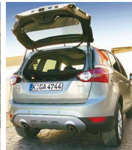
Erleichtert das Beladen: zweiteilige Heckklappe mit separat aufklappbarem Oberteil